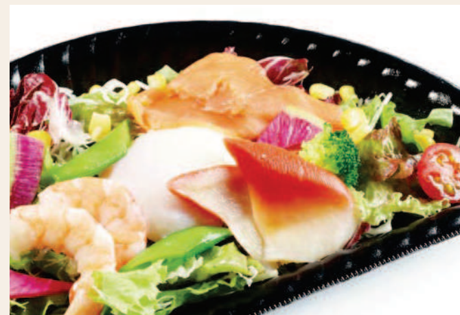
ENTシーフードサラダ ドレッシング:ごま/フレンチ/青じそ