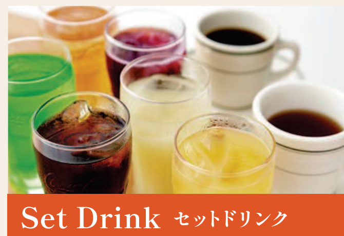
Set Drink セットドリンク