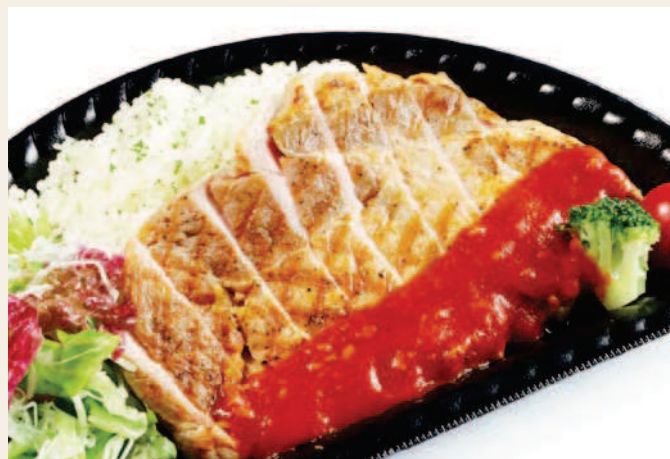
ポークステーキ ~バターライス&サラダ添え~ ガーリック風味のトマトソース

注文受付 Order Reception Hours / 15:00 ~ 21:30 商品お渡し Pick-Up Hours / 17:00 ~ 21:30