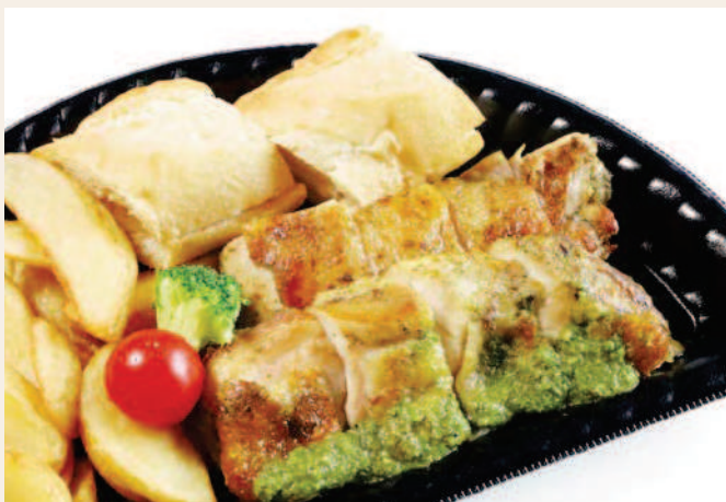
バジルチキンステーキ ~ガーリックトースト&フライドポテト添え~

Pork Steak with Garlic-Flavored Tomato Sauce ¥1,200