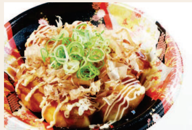
大阪名物 たこ焼き