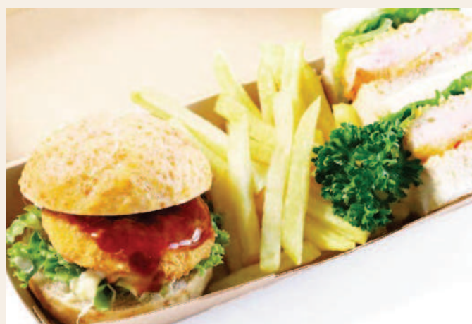
エビカツサンドとポークカツバーガー ~フライドポテト添え~

Shrimp Cutlet Sandwich and Pork Cutlet Burger ¥800