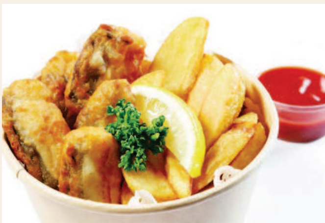
フィッシュ&チップス