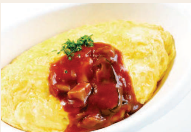
ふわとろ卵のオムライス ~デミグラスソース掛け~

Shrimp Cutlet Sandwich and Pork Cutlet Burger ¥800