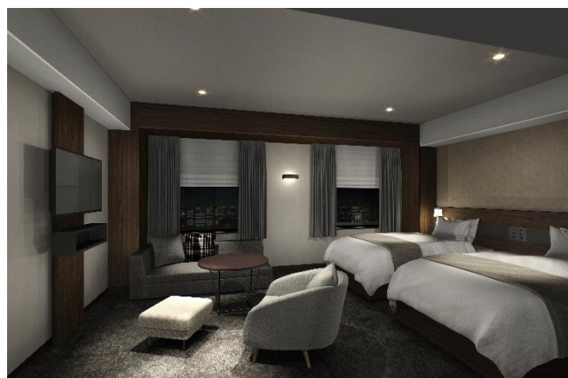
デラックススイート