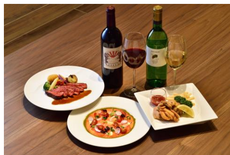
バータイムメニュー（一例）