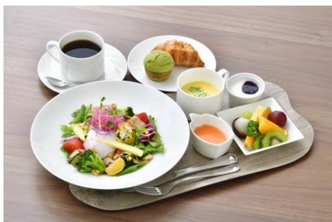
朝食メニュー（一例）