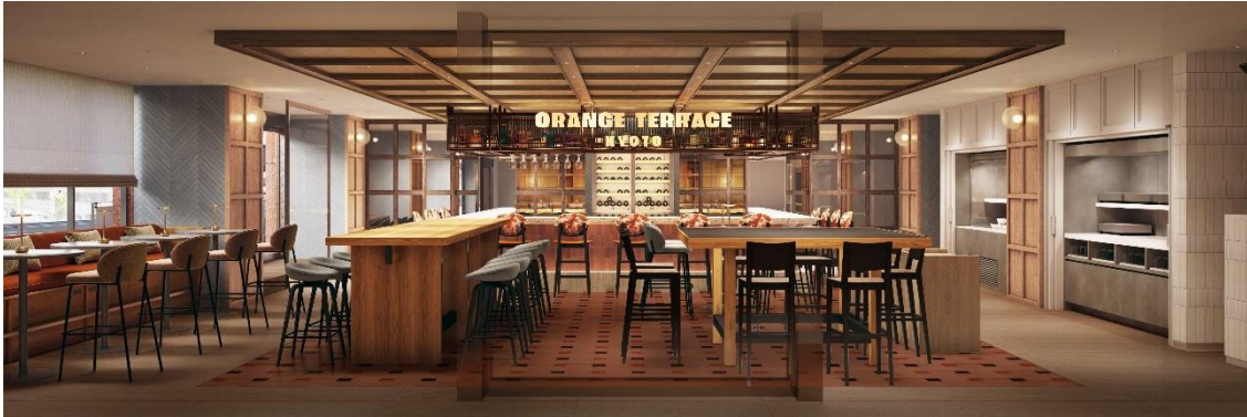
内観完成予想イメージパース

木やテラコッタオレンジをベースに食の気配を感じるボルドーやダークブラウンでアクセントを効かせ、外壁のレンガ色とリンクした空間。伝統的なモチーフに現代のエッセンスを加え、さりげなく京都を感じるダイニングです。