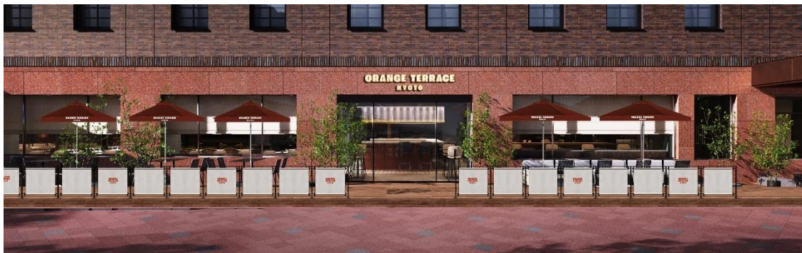
外観・テラス席イメージパース