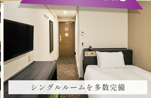
シングルルームを多数完備