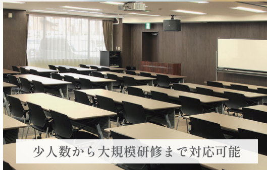
少人数から大規模研修まで対応可能