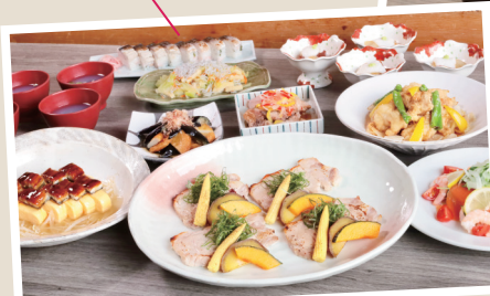
夕食にはご会食プランがオススメです!