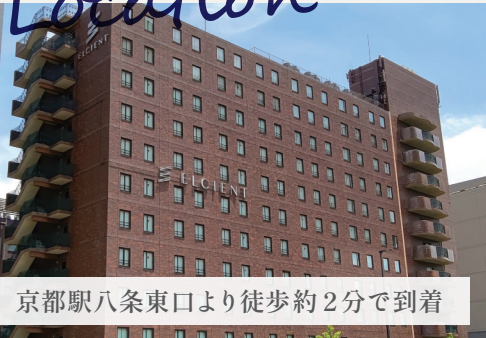
京都駅八条東口より徒歩約2分で到着