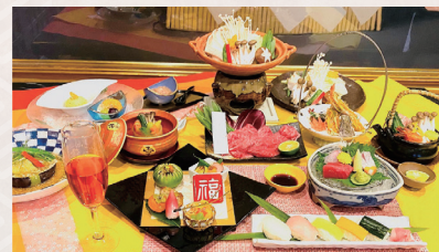
祇園小町 梅コース (イメージ)